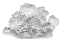
MF 59 Glace en Supergrains Eau résiduelle 15%